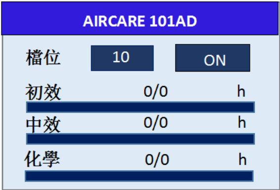
圖 4-1 主介面

連接好電源，連接好手持盒，打開主機電源開，開機後顯示主介面，按△、▽可切換檔位，共（1-10）10 個檔位，按 ON/OFF 控制檔位的的開關。