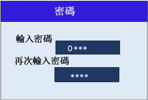
圖 4-3-8 更改密碼介面

在系統設置主介面，按▽鍵，選中密碼設置，如圖 4-3-8，按 SET 鍵，進入更碼設置介面，按△、▽鍵切換數值，按▷、◁鍵切換游標，輸入密碼後，按 SET 鍵再次輸入密碼，輸入後按 SET 確認，輸入兩次的密碼值一致則密碼設置成功，否則設置失敗。