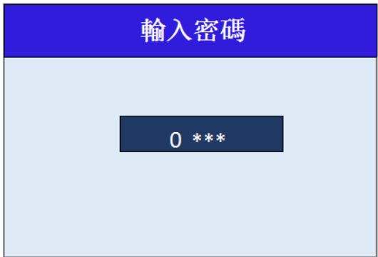
圖 4-2-1 輸入密碼介面

在手持盒未鎖定狀態下，長按 SYS 鍵（約 2 秒鐘），進入密碼輸入介面，如圖 4-2-1